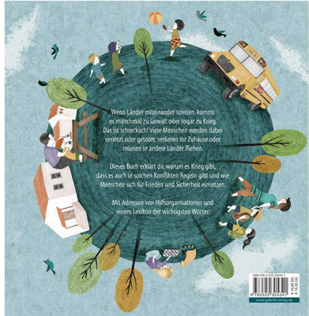
Weltkugel 3: Wie ist es, wenn es Krieg gibt? Alles über Konflikte | Große Fragen kindgerecht erklärt (ab ca. 5 Jahren)